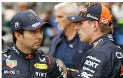
Nachfolger offiziell verkündet